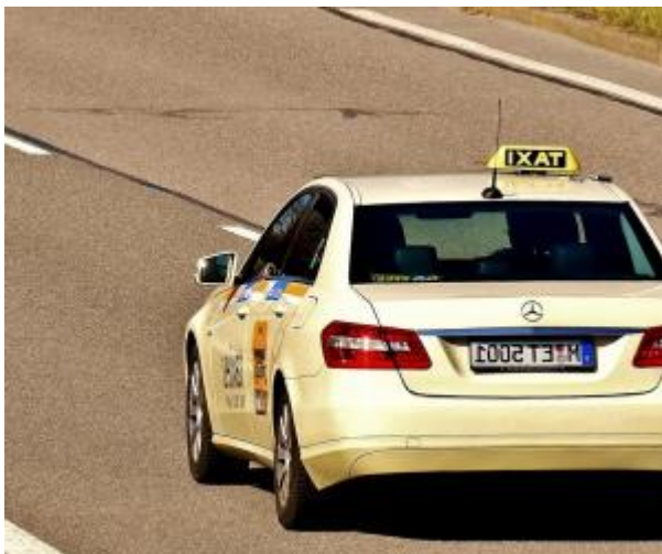
taxi-gf182aeafa_1920